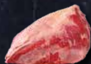
FESONE DI SPALLA