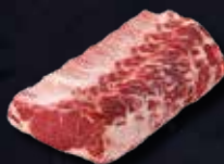
COSTATA CON OSSO