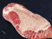
COPERTINA DI SPALLA