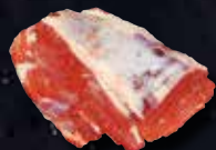
TESTA DI FILETTO